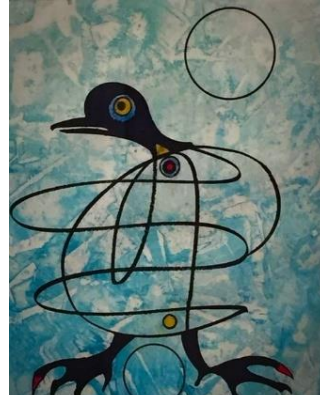
Oiseaux en péril de Max Ernst