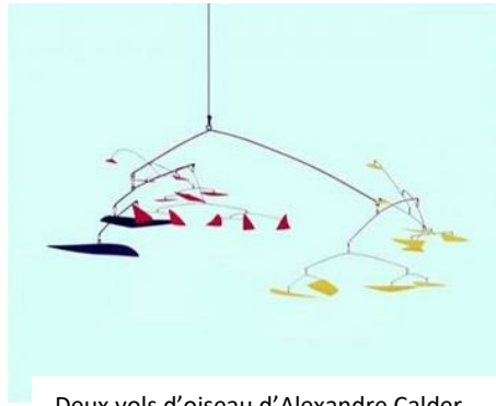
Deux vols d'oiseau d'Alexandre Calder